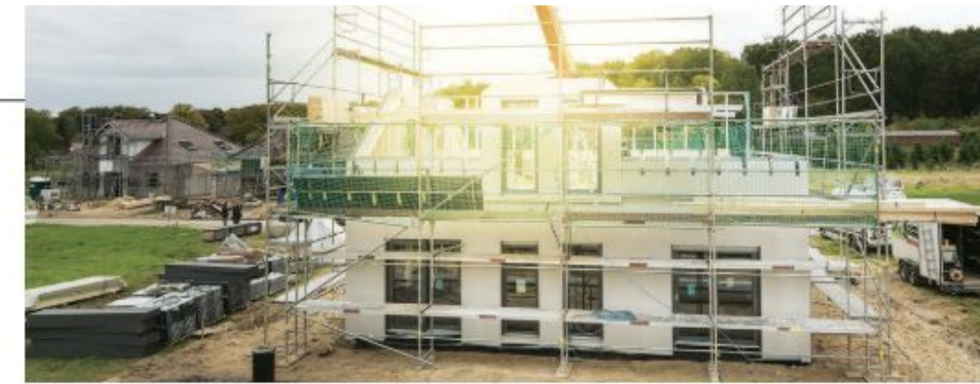
ZEITERSPARNIS: Die zügige Montage vorgefertigter Bauteile verringert die Bauzeit deutlich